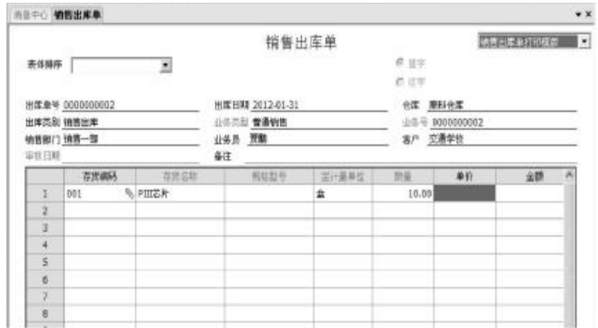
图4 无法修改销售出库单日期及表体数量