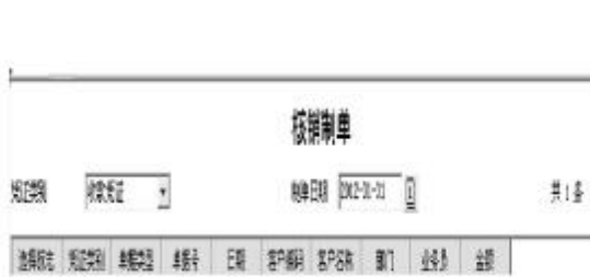
图12 核销制单列表为空