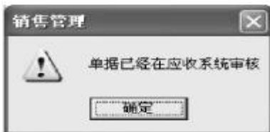
图7 应收系统已审核无法弃复

解析: 销售发票已经在存货系统进行仓储账的登记和生成凭证(借:主营业务成本;贷:库存商品)并传递至总账系统,财务人员也可能已根据该复核后的发票自动生成应收单据并已审核且生成凭证。也就是说,系统根据该发票已进行了后续⑤、⑦、⑨、⑩的操作。要对该单据进行弃复,需删除后期操作对应单据,取消审核、恢复记账及删除凭证。