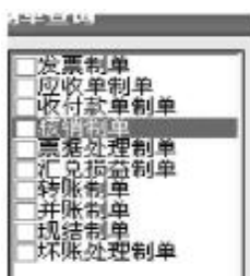
图11 核销制单无法选择