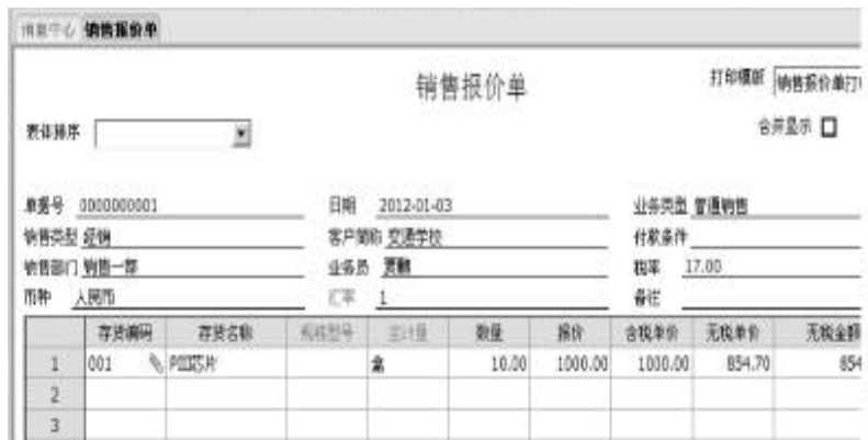
图2 销售报价单不能完成弃审操作

操作如下: ①检查销售发货单上仓库名称是否选择正确,若选择错误,则修改为正确的仓库名称。如果不可以保存,继续下一步操作。②供应链管理/库存管理模块/盘点业务。打开盘点单界面,选择“增加”,修改盘点日期为发货单当天,盘点仓库为发货单表体仓库,对该存货进行盘库,查看现有库存信息,是否满足发货条件。如果不