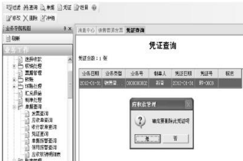
图8 删除应收款模块生成凭证

【基金项目】2014年广东省高等职业教育教学改革项目“基于行动导向的高职会计信息化相关课程项目化教学探索与实践”(编号:201401312)