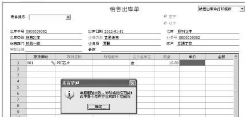
图5 无法删除销售出库单