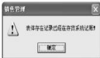
图6 存货系统记账无法弃复

解决办法: 与问题4不能复核操作类同,完成逆操作⑨-⑤-⑩-⑦,取消根据该发票所进行的后续操作。弃审该发票,进行现结后再复核。