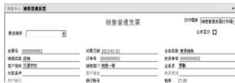
图10 “现结”为灰色,不可操作