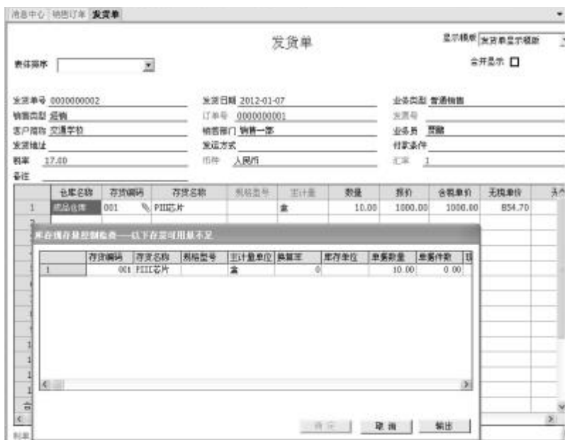
图3 销售发货单不能保存