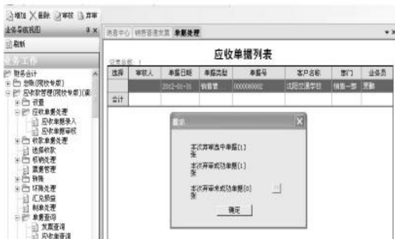
图9 弃审由复核发票自动生成的应收单据